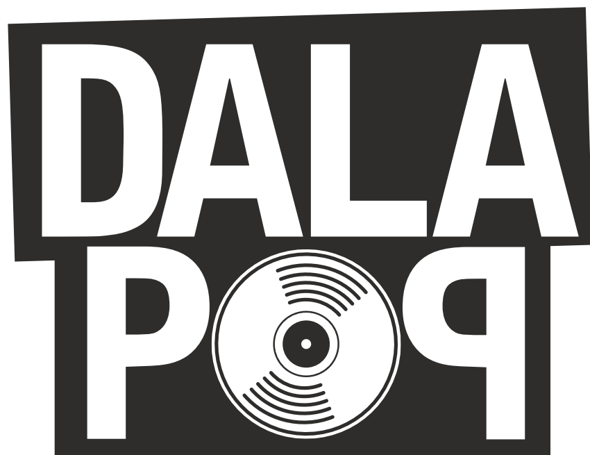
Svart positiv variant