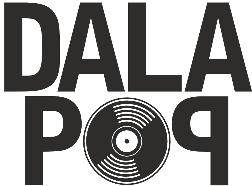
Svart positiv frilagd logotyp